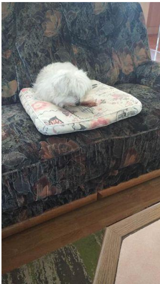
Spokojená hluchoslepá Mia